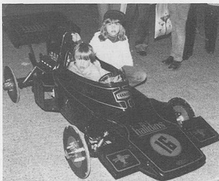
Vinnande bil i elegantävlingen med förare och mekaniker

Ett stort tack ska riktas till alla funktionärer från SSK och BSFK som gjorde ett enormt fint jobb med uppbyggnad av utställningen och genomförande av bl a lådbilstävlingen. Utan deras frivilliga insatser skulle det vara svårt att genomföra ett så stort arrangemang. Nu kan vi hoppas på en ny och ännu bättre utställning nästa år och kanske på ett nått litet överskott till klubben, som ju har många håll att stoppa i.