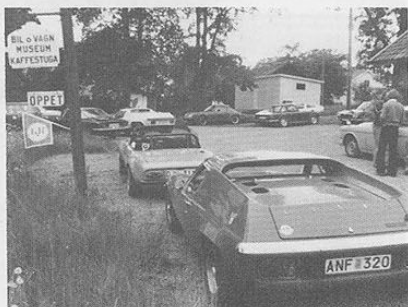
Rallyt avslutades med kaffe och smörgås vid Håkan Knutssons bil- och vagnsmuseum.