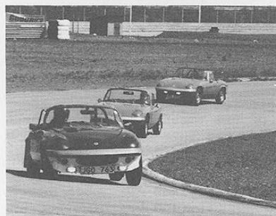
Bankörningen var mycket uppskattad av deltagarna. Här ett gäng från Lotusklubben med Elaner.

Här ses bl a en norsk deltagare som inte sparade på krutet i sin Jaguar E-type V12.