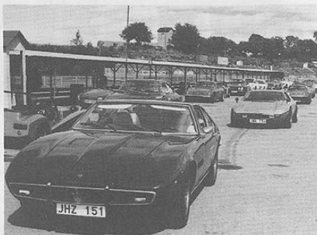
Depån är ett Mecka för sportvagns-älskare: Maserati, Ferrari, Lotus, Triumph, MG, Alfa Romeo, Marcos, Austin-Healey, m fl.