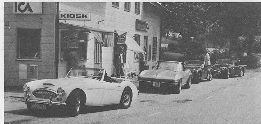
Glasspaus under sportvagnsrallyt på Kinnekulle