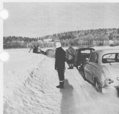
Snö i vinter Det var 1970